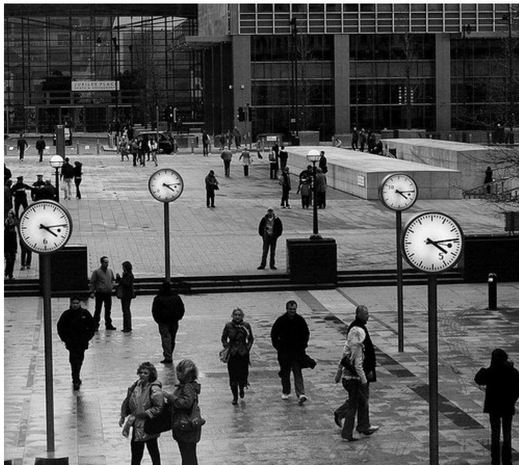
Grainyday, 2008. Certains droits réservés ©

Les jeunes sont des citoyens qui mettent en place des projets de développement et des actions collectives d'utilité sociale. Ils participent en tant que citoyens à l'élaboration des droits qui les concernent, directement ou indirectement. Pour faciliter cela, des espaces sont requis pour qu'ils soient vus et entendus. Par exemple, les manifestations collectives, telles les grèves étudiantes, sont une forme d'expression et de revendication des droits des jeunes qui doit être respectée et non taxée de « caprice ». L'objectif est de passer des droits formels aux droits réels, ce qui nécessite une éducation sur ces mêmes droits et sur les pratiques citoyennes possibles.