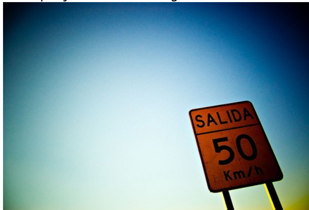
GabriellR. 2008. Certains droits réservés ©

Les programmes de prévention ou de dépistage ne sont pas juste précoces mais bien « féroces ». Étant perçus comme dangereux pour la société et leurs enfants, les jeunes parents sont désormais guettés et contrôlés. Cependant, les jeunes ont droit à devenir des parents à part entière, sans être toujours ramenés à une incompétence ou une irresponsabilité supposées.