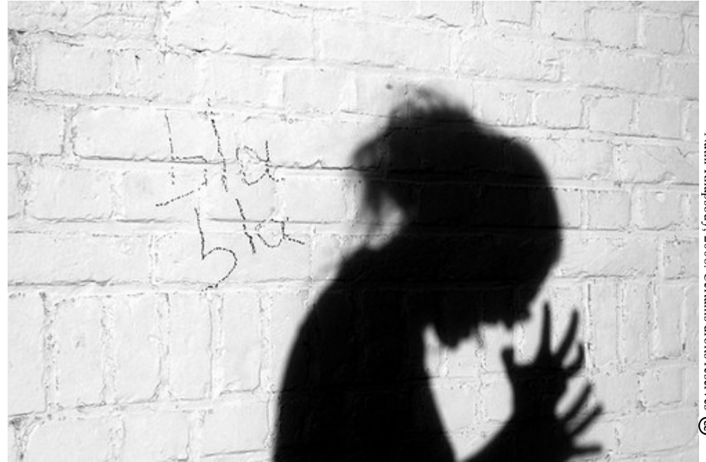
Nathi Rhapsody, 2008. Certains droits réservés ©

Les jeunes sont également confrontés à diverses réalités dans le domaine du logement. Pour certains, il s'agit d'un choix, parfois vécu comme une obligation, de rester chez leurs parents et de subvenir parfois à leurs besoins, autant pendant qu'ils sont aux études que lorsqu'ils débutent sur le marché du travail. Pour d'autres, il s'agit au contraire du défi de se trouver un autre toit lorsque les parents n'ont pas les moyens ou lorsque d'autres contraintes liées aux rapports familiaux encouragent, ou forcent tout simplement, à quitter le nid familial.