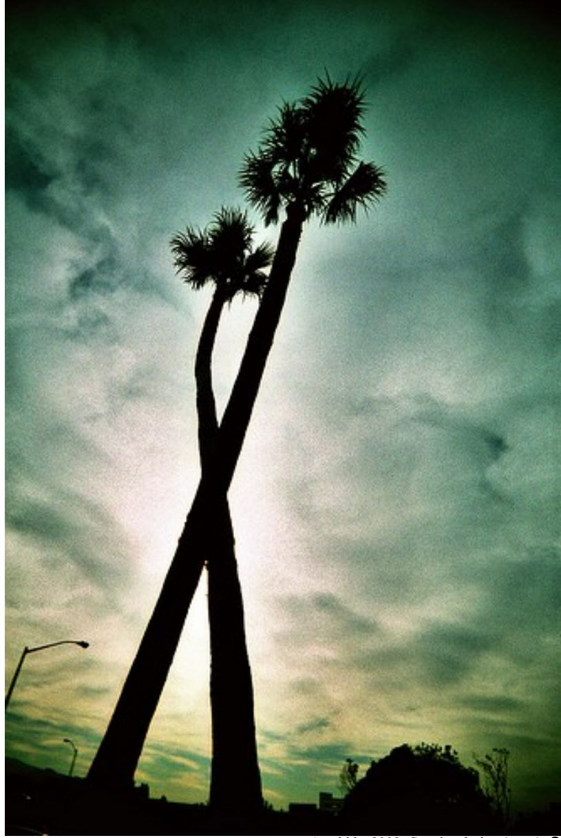
Arachide, 2008. Certains droits réservés ©

« Parler de droits de cité, c'est avant tout ramener les jeunes de la cité vers un projet citoyen, en trouvant des moyens pour favoriser leur propre estime en vue d'un désenclavement tant sur le plan géographique que moral. » (Léonard)