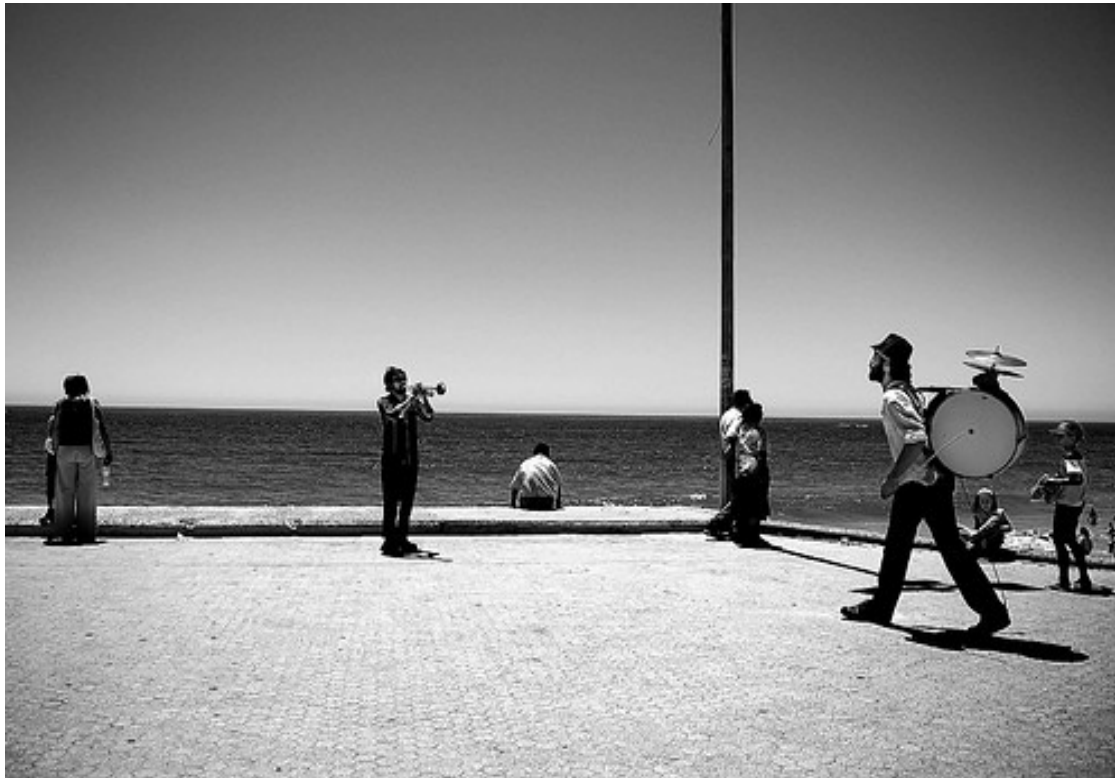
GabrielR, 2008. Certains droits réservés ©

« Faire connaître les dispositifs participatifs de notre démocratie et les lieux où peut s'exprimer un point de vue est primordial. » (Émilie)