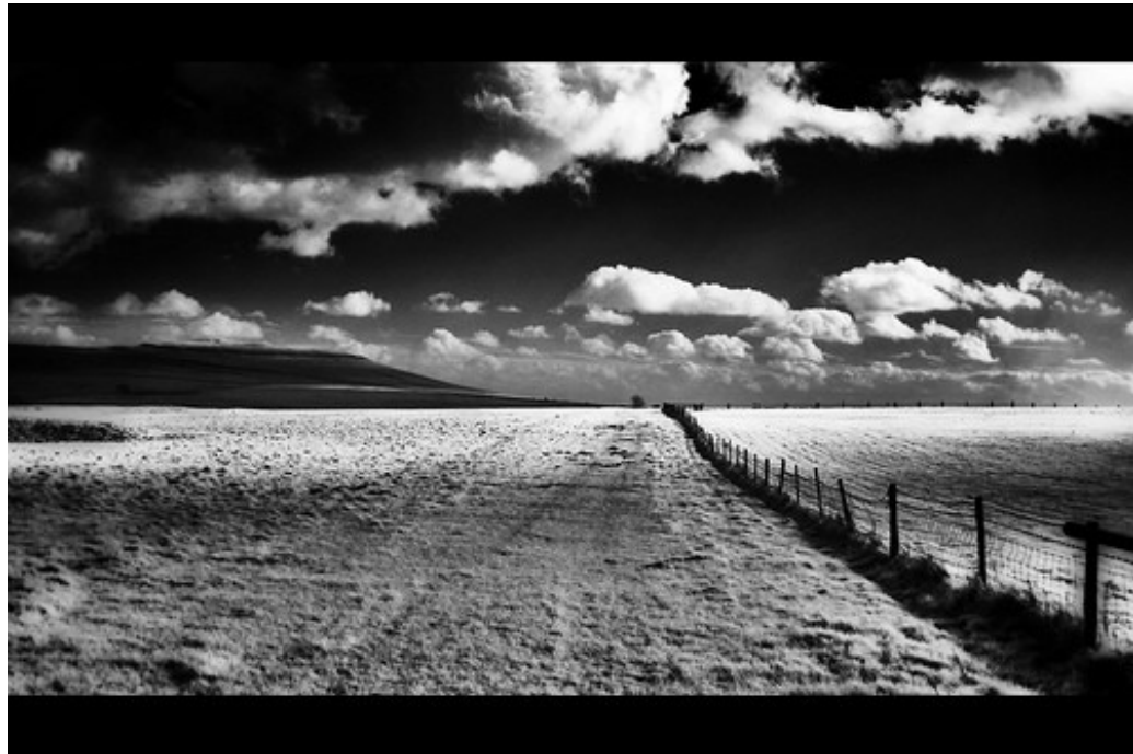
Yexed&Confused, 2008. Certains droits réservés ©

« S'entourer de personnes qui nous ressemblent est beaucoup plus rassurant que de se voir confronté à autrui dans toute sa différence. » (Nathalie)